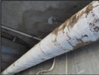
Photo N° 659 ECH-N°2 CALORIFUGEAGE --LOCAL POUBELLE Conduits de fluide Laine minérale + enveloppe plâtrée

Dossier n°: 2013-09-300 FK DTA PC_041LAS_OPH