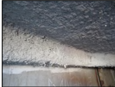
Photo N° 662 AMIANTE CIMENT -- LOCAL POUBELLE Conduits Ventilation haute (Fibres-ciment)