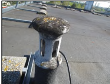
Photo N° 666 AMIANTE CIMENT -- Toiture terrasse Toiture Chapeau (Fibres-ciment)