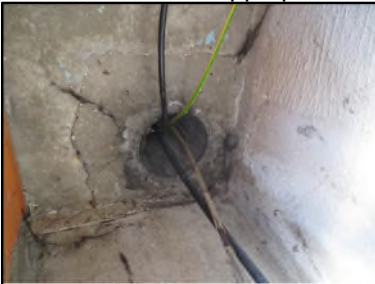
Photo N° 665 AMIANTE CIMENT -- Gaine technique Gaz - 4 Conduits Ventilation haute (Fibres-ciment)